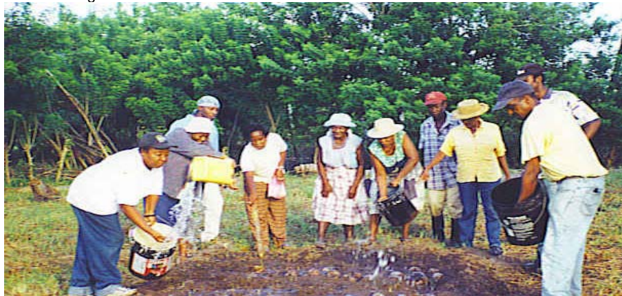
El Comité de Emergencia Garífuna, Honduras

El Comité organizó comités de comunidad en 16 comunidades Garífunas, visitaron escuelas, iglesias y centros comunitarios para establecer espacios seguros para familias desplazadas y realizaron un mapeo de las áreas vulnerables y de alto riesgo en la comunidad. (Encontraron que Santa Rosa de Aguan estará permanentemente en riesgo de inundaciones y ataque de huracanes.) Para lograr la inmediata restauración de las viviendas, establecieron bancos comunitarios de herramientas agrícolas y lucharon por obtener nuevos títulos de sus casas y tierras para ayudar a los residentes afectados. Durante los últimos siete años han trabajado para reconstruir casas, negociar con el gobierno local para suministros de construcción adicionales, y han establecido con éxito casi a 200 familias en casas en la nueva comunidad de Santa Rosa de Aguan con una elevación más alta. El Comité también trabaja por resiliencia a largo-plazo concentrándose en reforestación, preservación de la identidad cultural, organizando a la juventud, y aumentando la seguridad alimenticia a través del procesamiento de yuca, el almacenamiento de comida y la creación de bancos de semilla indígenas.