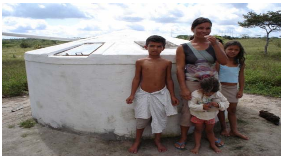
Red de Pintadas, Brasil